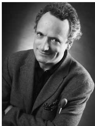
Louis Langrée et l'Orchestre de Paris

Après avoir fait ses débuts avec l'Orchestre de Paris en 1991 dans un programme Mozart, Louis Langrée a retrouvé l'Orchestre de Paris depuis dans Fortunio de Messager à l'Opéra-Comique en décembre 2009, puis en avril 2011, pour un mémorable Pelléas et Mélisande en version de concert au Théâtre des Champs-Élysées, puis au Barbican Centre à Londres.