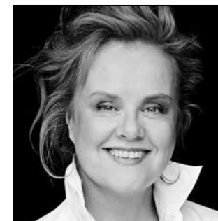
Petra Lang et l'Orchestre de Paris

Petra Lang fait ses débuts à l'Orchestre de Paris à l'occasion de ces deux concerts.