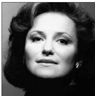
Luba Orgonášová et l'Orchestre de Paris

Luba Orgonášová a fait ses débuts à l'Orchestre de Paris en 1997 également dans la Symphonie n° 9 de Beethoven.