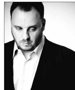
Matthias Goerne et l'Orchestre de Paris

Partenaire fidèle de l'Orchestre de Paris, Matthias Goerne sera de retour la saison prochaine (le 11 mai 2016) pour interpréter 3 monologues de héros wagnériens.